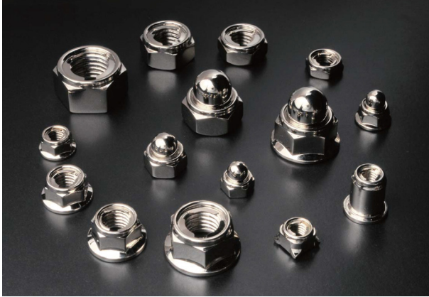
E-LOCKシリーズ 製品写真