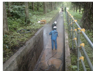
①高圧水による洗浄