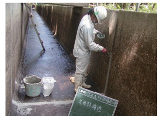
②欠損部のモルタル補修