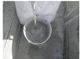
④モルタル塗り準備工