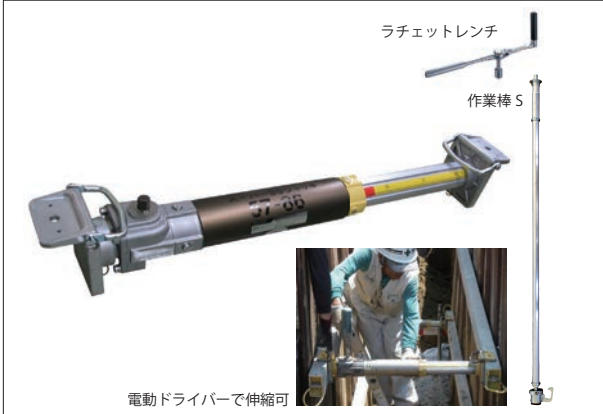
スーパーSSジャッキ (技術名：アルミギア式サポート)