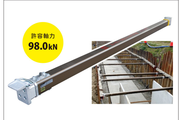
スーパーSSジャッキST型 (技術名：アルミギア式サポートST型)

[拠点] 東北支店 (TEL.019-639-9200)、東京支店 (TEL.042-646-4600)、大阪支店 (TEL.072-883-5151)、九州支店 (TEL.092-504-1335)、中部営業所 (TEL.052-875-8515)、広島営業所 (TEL.082-239-5500)、大阪工場 (TEL.072-885-5433)、大分工場 (TEL.097-521-8200)