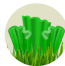
断面をオメガ型・S型という2種類の形状で製作