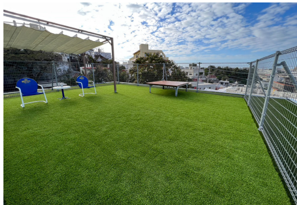
子供のいるご家庭の庭やベランダに