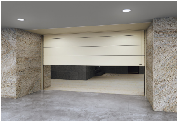
防水シャッター 防火・防煙タイプ