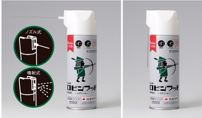
ロビンフッド®製品写真

〒103-6020 東京都中央区日本橋2-7-1 東京日本橋タワー TEL 03-6630-3322、0570-058-669 URL https://www.i-nouryoku.com/index.html mail HP内問い合わせフォームあり