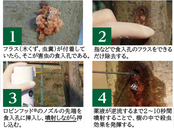
ノズル式処理手順