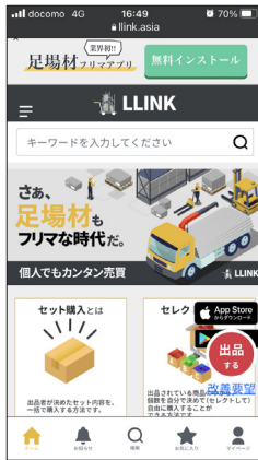
スマホ版ホーム画面