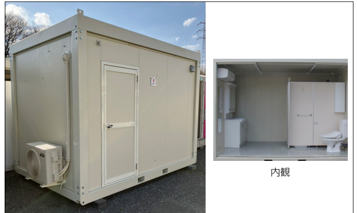
ブリリアントW (洗面室+トイレ2基)