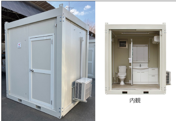
ブリリアントS (洗面室+トイレ1基)

【拠点】札幌営業所 (TEL.011-769-7631)、東北支店 (TEL.0224-85-2331)、静岡営業所 (TEL.0548-32-6661)、名古屋支店 (TEL.0567-33-0077)、大阪支店 (TEL.06-6260-1122)、広島支店 (TEL.082-819-1877)、四国支店 (TEL.087-832-8181)、九州支店 (TEL.092-957-6812)