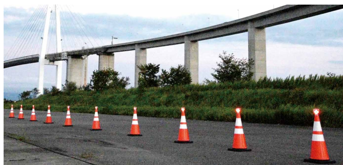
24Hアイコレクト (赤) の日中発光 (明るく、視認性良好)