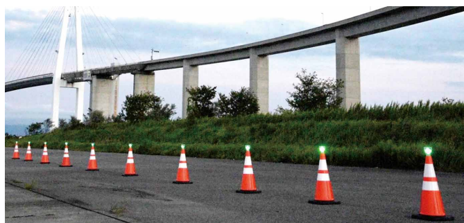
24Hアイコレクト (緑) の日中発光 (明るく、視認性良好)