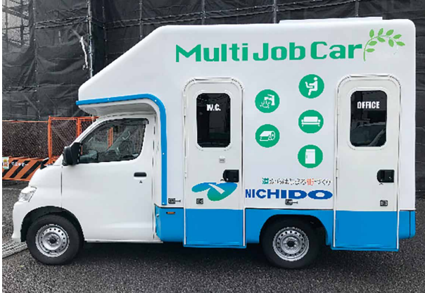
快適トイレ付移動事務室車 マルチJobCar®