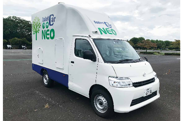
自走式快適トイレ トイレカーNEO