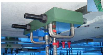
新型ジャッキによる緊張状況