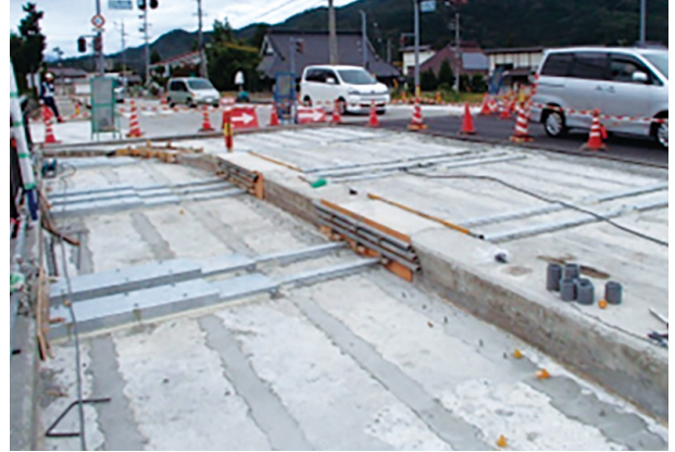
アウトプレートによる橋軸直角方向の補強