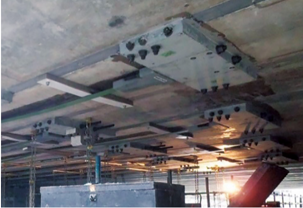
アウトプレートによる橋軸方向の補強

[正会員] 株式会社IHIインフラ建設、オリエンタル白石㈱、川田建設㈱、極東興和㈱、株式会社国際建設技術研究所、コーアツ工業㈱、日鉄ケミカル&マテリアル㈱、ドーピー建設工業㈱、日本高圧コンクリート㈱、㈱日本ピーエス、ピーエス・コンストラクション㈱、㈱富士ビー・エス、三井住友建設鉄構エンジニアリング㈱